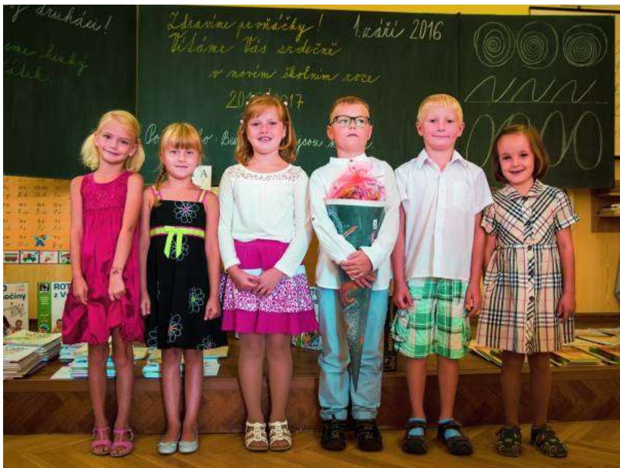
Naši letošní prvňáčci