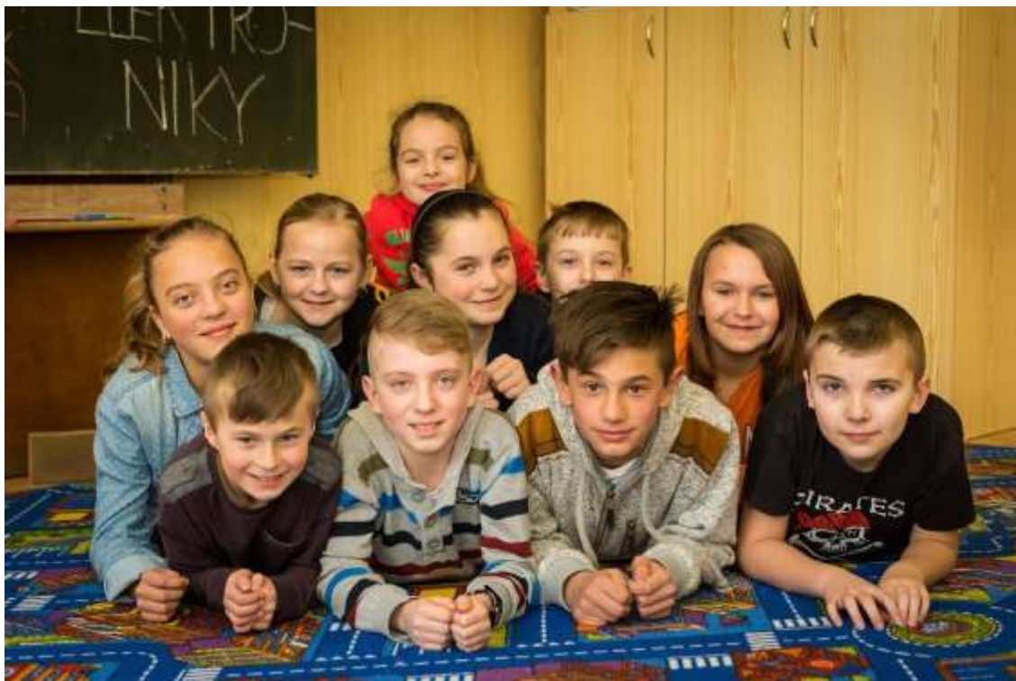
II. třída -10-